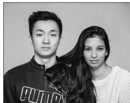
© Thomas Lingens, (Helmut und Viktoria)