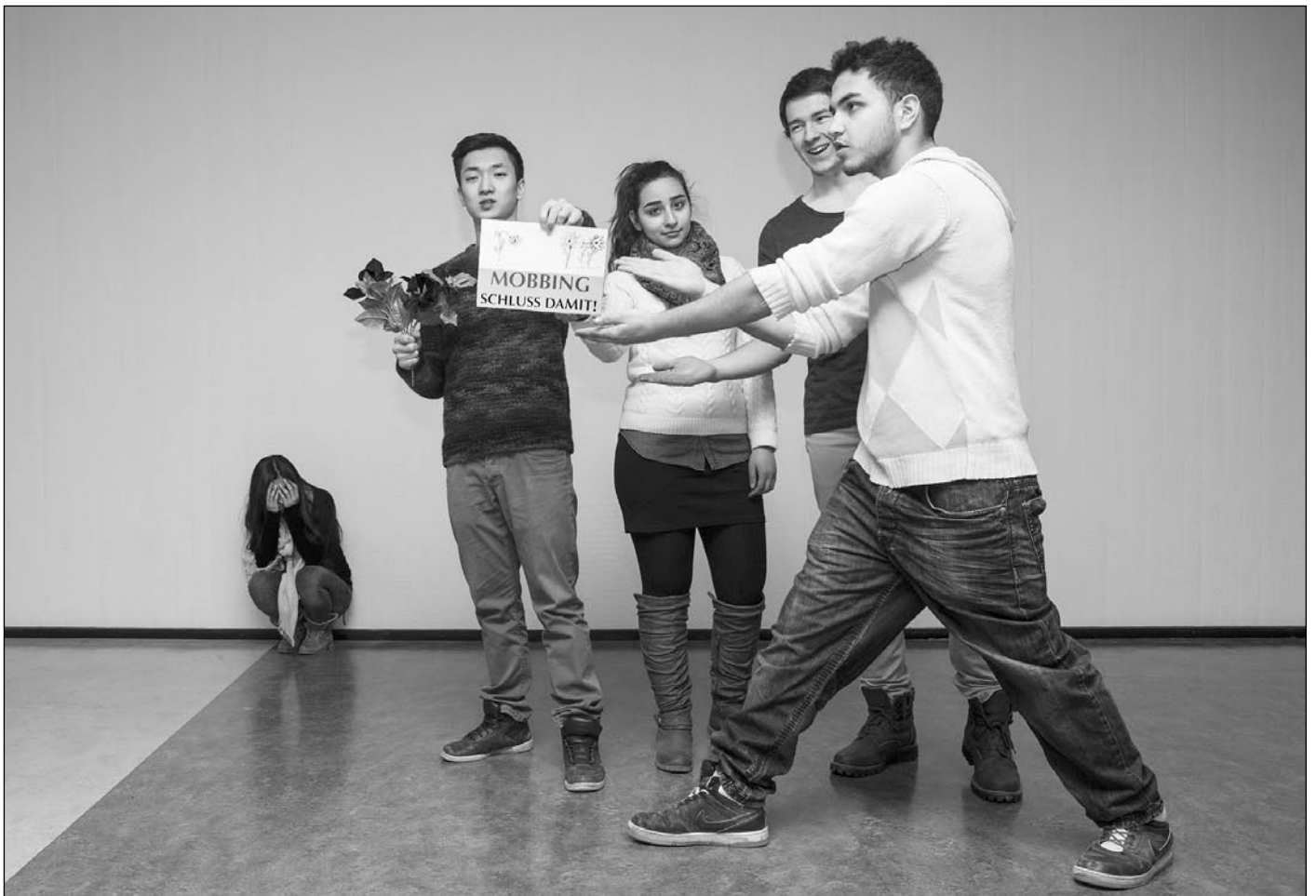
© Thomas Lingens, »Mobbing - Schluss damit!«