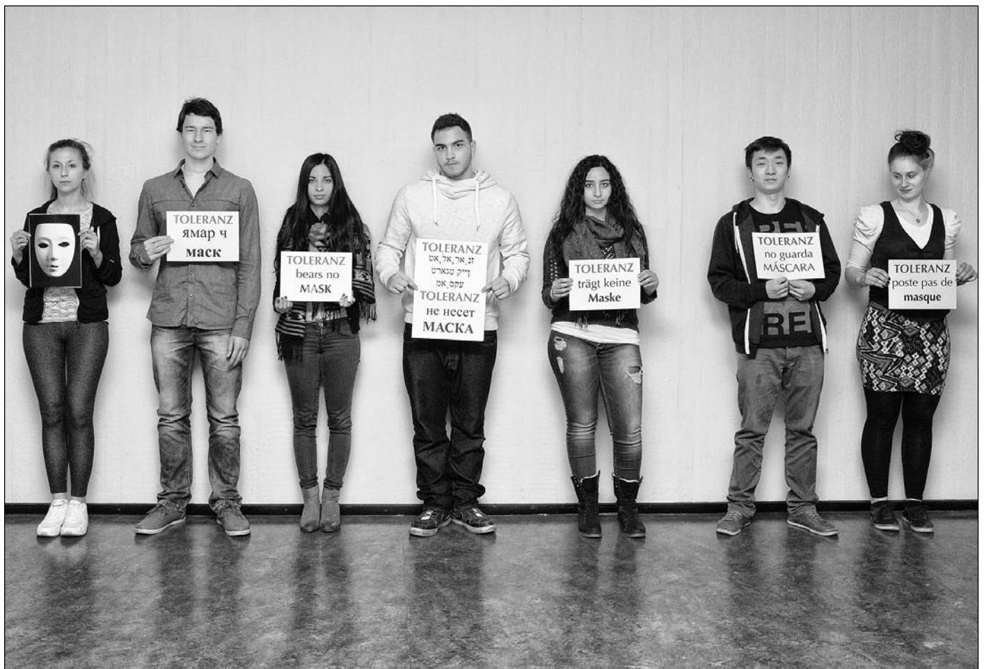
© Thomas Lingsens, »TOLERANZ trägt keine Maske«