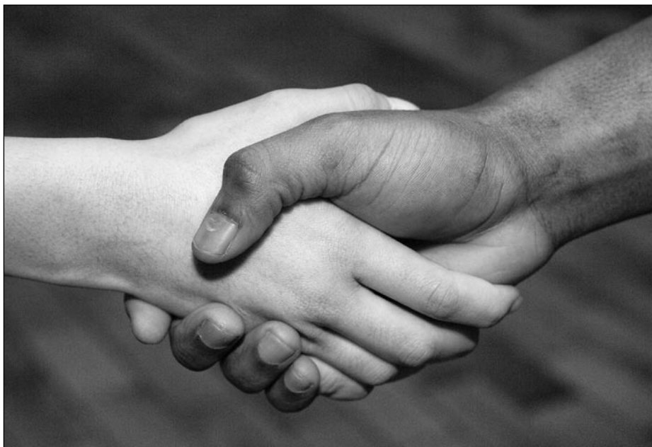
© Thomas Lingens, Freundschaft überwindet Grenzen

Anonymous Gesichtsmaske fallen lässt und durch ein Schild mit der Aufschrift »Toleranz trägt keine Maske« in seiner Familiensprache ersetzt.